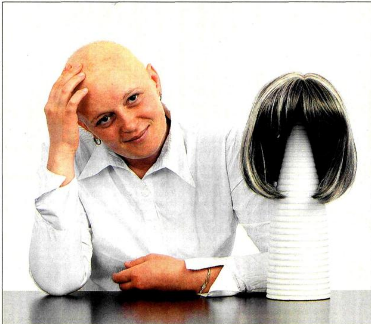
Kanker het 'n invloed op alle aspekte van jou lewe – ook jou sekslewe. Maar dit hoef nie die einde daarvan te beteken nie, sê die skrywers van Sexy Ever After: Intimacy Post-Cancer .

“Baie mense (wat deur kanker geraak word) se vertroue in wie hulle is, neem af. Ons wy 'n hele afdeling van die boek aan wenke om